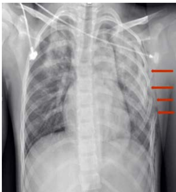
FIGURA 1. Radiografía de tórax. Fracturas costales